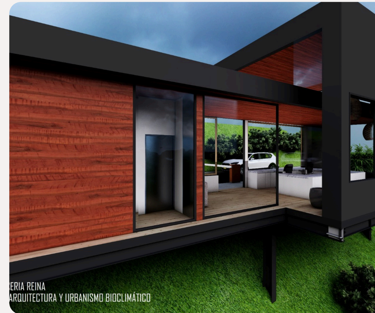
Zona de espera y recepción